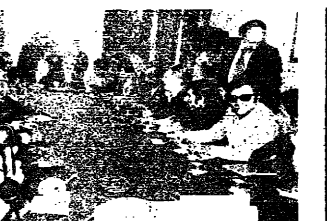
في اجتماع هيئة الحوار الرئيسية كرامي يتوسط الرئيس سلام والشيخ بيار الجميل، والمعيد اده والوزير عثمان توينسي، والسيد عاصم قاصو، ويبدو الدكتور نجيب قراوتج، والدكتور الياس سبيا

سلسلة الانفجارات التي حصلت في امكن متفرقة من بيروت أمس لم تقص المور الذي قامت به لجنة التنسيق العسكرية الموسعة، وهدية الحوار الوطني لوقف الانتفاضة بصورة عاجلة، وتحت امنية اعتبارا من صباح اليوم. وقد نفذت التدابير الامنية التي اتفق عليها بين مختلف الاطراف من قوات من الجيش لتنفيذ مهامها في المنطقة الخضراء، ونقلت قوات من الامن الداخلي الى الشوارع - عين الرمانة. بينما سيرت قوات دوريات وقامت حواجز تفتيش واعطيت اوامر لصد المخالفين.